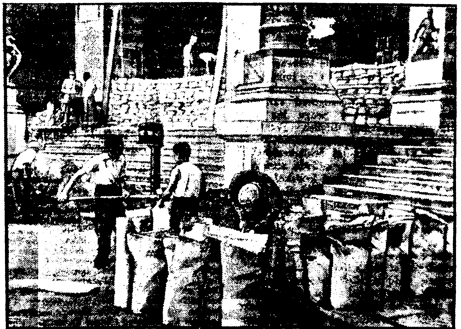
OHUKAITSE ETTEVALMISTUSED ROOMAS.

Pärast koosolekut rahvas astus elavasse vestlusse punaarmee, kelle esindajad kut- susid rahvast oma kinno. Koosolek kiitis heaks valitsuse deklaratsiooni.